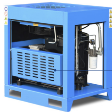
Transmission courroie avec grille de protection