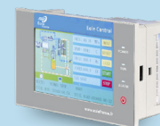
Contrôleur ÉOLE 6070