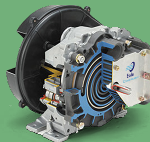
Bloc de compression à spirales sans huile