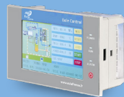
Contrôleur ÉOLE 6070