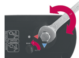
Ouverture et fermeture de la vanne manuelle possible, en cas de panne de courant électrique