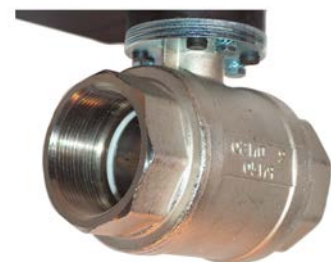
La valve est en laiton nickelé

JORC est certifié NEN - EN - ISO 9001:2015