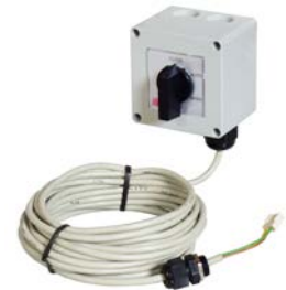
Option de contrôle à distance