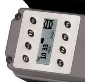
Minuterie à quartz intégrée avec écran LCD